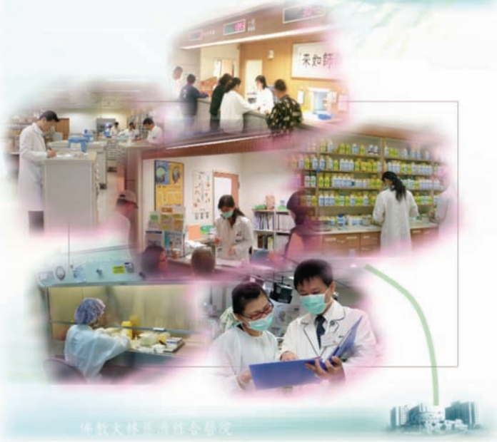
佛光大林慈濟聯合醫院