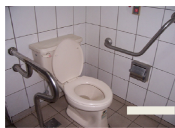
便盆加裝雙側扶手