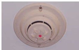
圖 1. 火警自動 (偵煙) 警報器