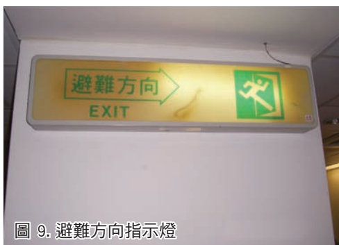
圖 9. 避難方向指示燈