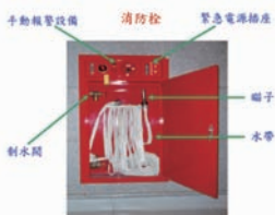
圖 5. 室內消防栓