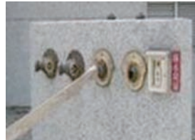
圖 6. 室外消防栓