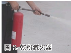
圖 3. 乾粉滅火器