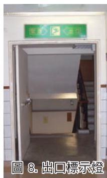
圖 8. 出口標示燈