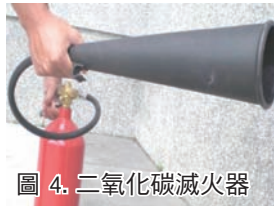
圖 4. 二氧化碳滅火器