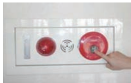
圖 2. 手動報知 (火警) 設備